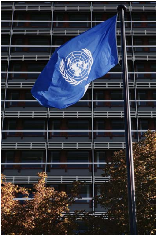
Der UN-Campus in Bonn

Im Namen des gesamten neu gewählten Vorstandes möchten wir alle Leser von „Auf der Agenda“ herzlich zur dritten Ausgabe der Vereinszeitung von BIMUN/SINUB e.V. begrüßen. Nach der Wahl im März hat der diesjährige Vorstand nun seine Arbeit aufgenommen und erste inhaltliche und organisatorische Vorbereitungen im Hinblick auf die anstehende Simulationskonferenz, die voraussichtlich in der ersten Dezemberwoche stattfinden wird, getroffen.